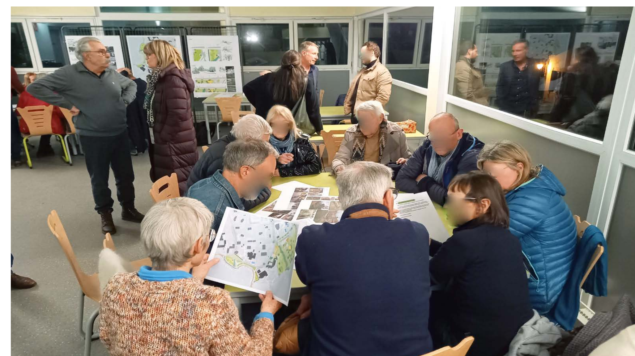
Ateliers participatifs du jeudi 26 février 2024

A travers des projets comme ceux exposés, il est possible de faire participer les habitants et les habitantes. C'est ainsi que la commune a souhaité durant la phase conception, l'organisation de moments de concertation comme en témoignent les soirées organisées en février et en juin 2024 pour l'aménagement du front de lac .